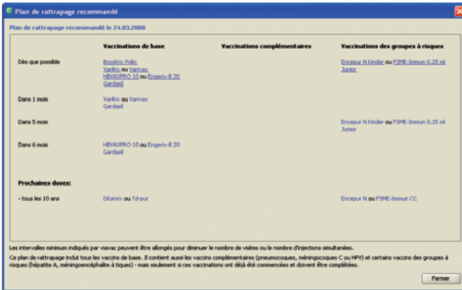
Figure 2: Plan de rattrapage recommandé.

prochains rappels nécessaires? Permettre d'offrir une prise en charge vaccinale individualisée de haute qualité tout en faisant gagner un temps considérable?