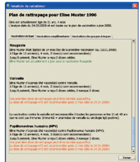
Figure 3: Résultats du calculateur (extrait).

La version 2008 de viavac contient les algorithmes de calcul pour toutes les vaccinations de base (Di, Te, Pa, IPV, Hib, hépatite B, rougeole, rubéole, oreillons, varicelle et